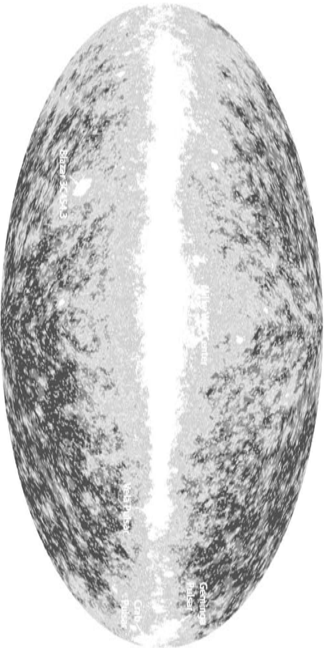
Figura 2. Primer mapa de rayos gamma del cielo proporcionado el 28 de agosto de 2008 por el equipo del telescopio Fermi. La imagen, en colores falsos, toma como referencia el plano de la Vía Láctea (“Milky Way”), que se coloca en el centro. A lo largo de él se observa una nube de rayos gamma producida por la difusión de rayos cósmicos de alta energía en el gas y polvo interestelar. Se han destacado algunas fuentes muy intensas de rayos gamma, como estrellas de neutrones o púlsares, y galaxias distantes muy activas, conocidas como “blazars”. Este mapa es el resultado de tan sólo cuatro días de observaciones, y la información es equivalente a la que podía obtenerse con la anterior generación de telescopios en un año 65 .